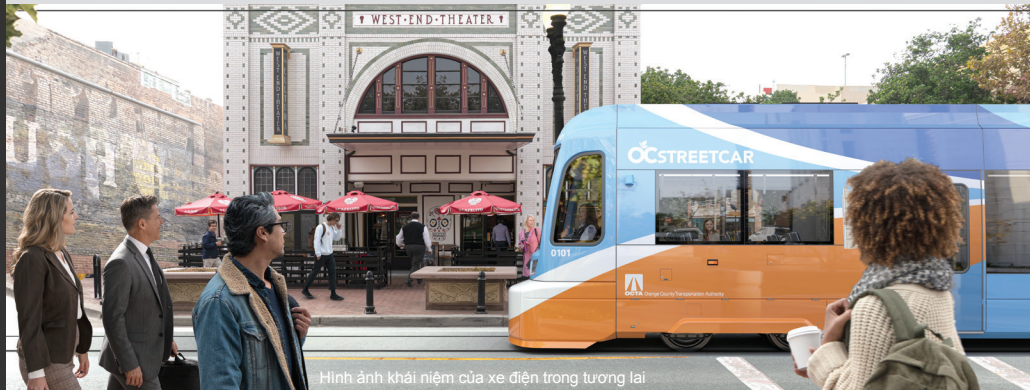
Hình ảnh khái niệm của xe điện trong tương lai