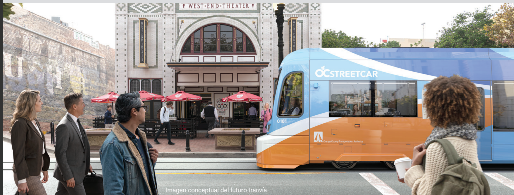
Imagen conceptual del futuro tranvía