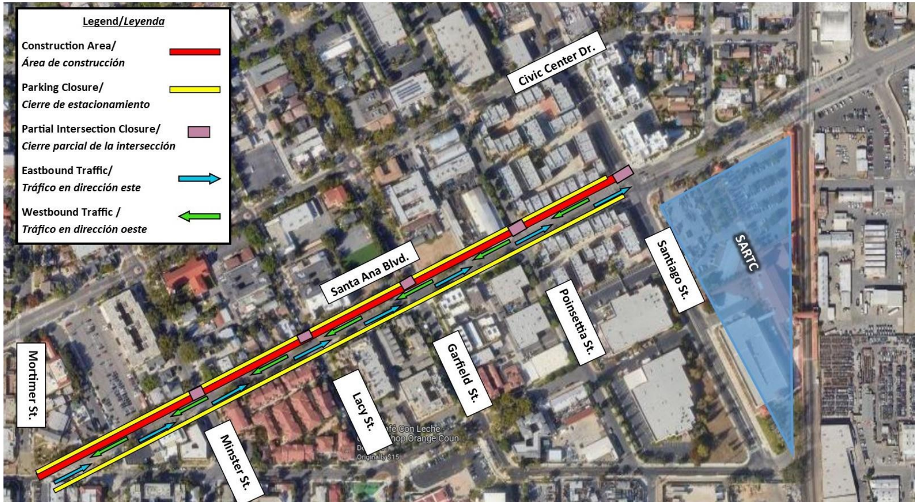
Westbound construction on Santa Ana Boulevard from Mortimer Street through Santiago Street Construcción en dirección oeste en Santa Ana Boulevard desde Mortimer Street hasta Santiago Street