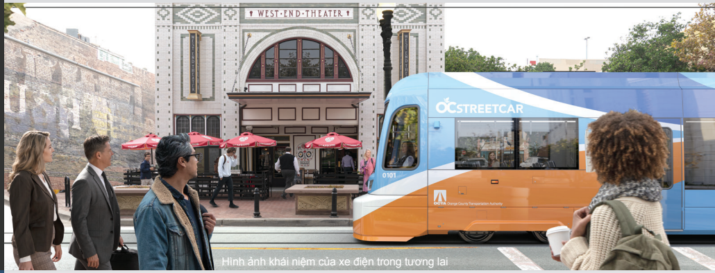
Hình ảnh khái niệm của xe điện trong tương lai